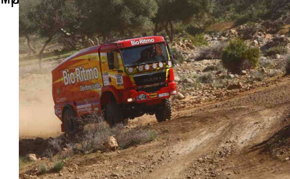
Ковска сама на Животрева №199, Б. Малинко, российский авто